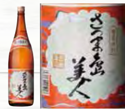
さつま焼酎 島美人

ミネラル豊富な赤土育ちでホクホクです。しっとりとして煮崩れしないのでコロッケ、肉じゃが、カレーなど、どんな料理にもぴったり。