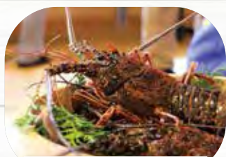
えっがね(伊勢海老)

甘くてぷりぷりした身が特徴の、肝付町のえっがね。春と秋には、肝付町の各指定店舗にて、えっがね料理を普段より安価で食べられる「えっがね祭り」を開催しています。