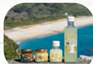
へっが 辺塚だいだいを使った加工品

内之浦宇宙空間観測所門衛所の前に、2019年8月、宇宙グッズを販売するお店「宙の家」がオープンしました。ここでしか買えない肝付町観光協会オリジナルのグッズなど販売中です。